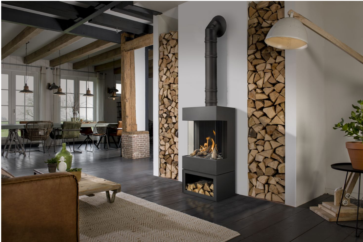
Kaminofen Gas Panorama 45/17/45/17 mit Stahlsockel