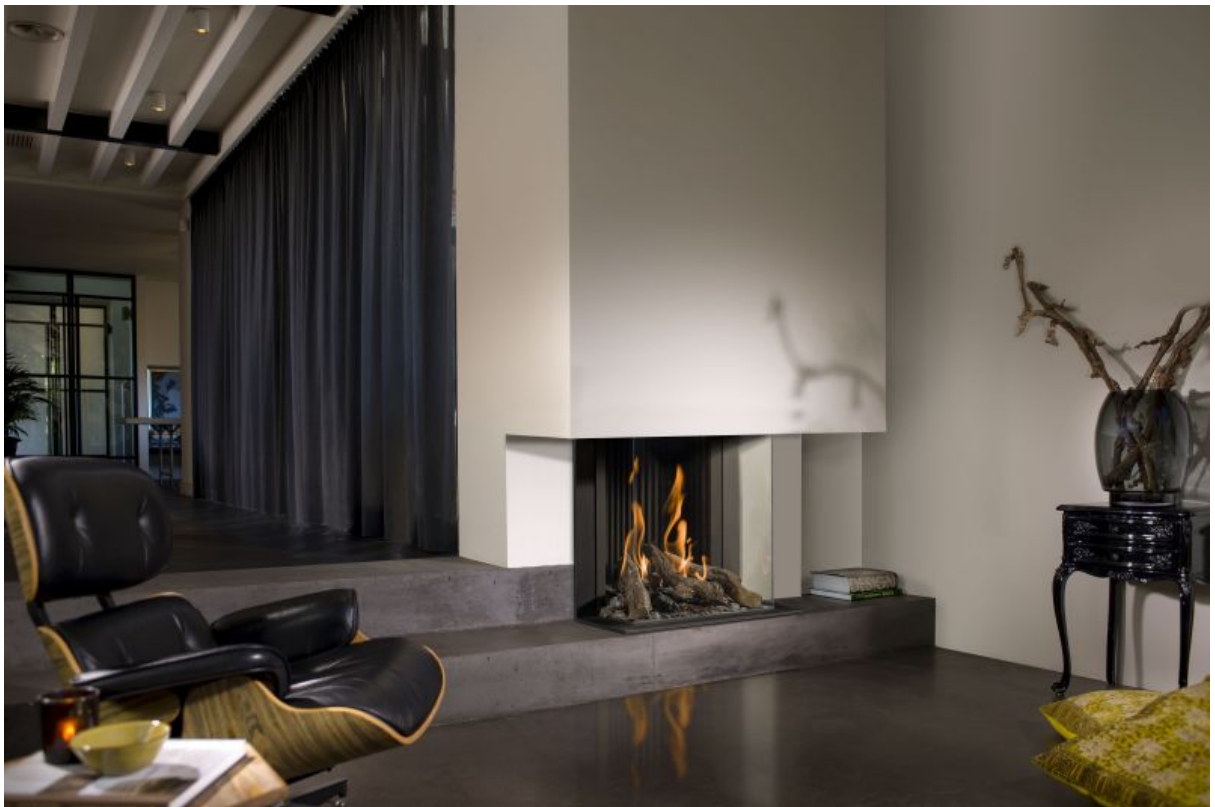
Panorama-Kamin Gas 45/17/45/17