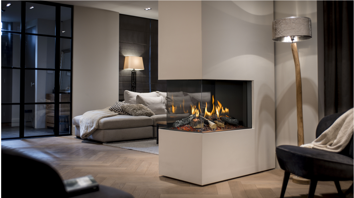
Panorama-Kamin Gas 43/75/38/75