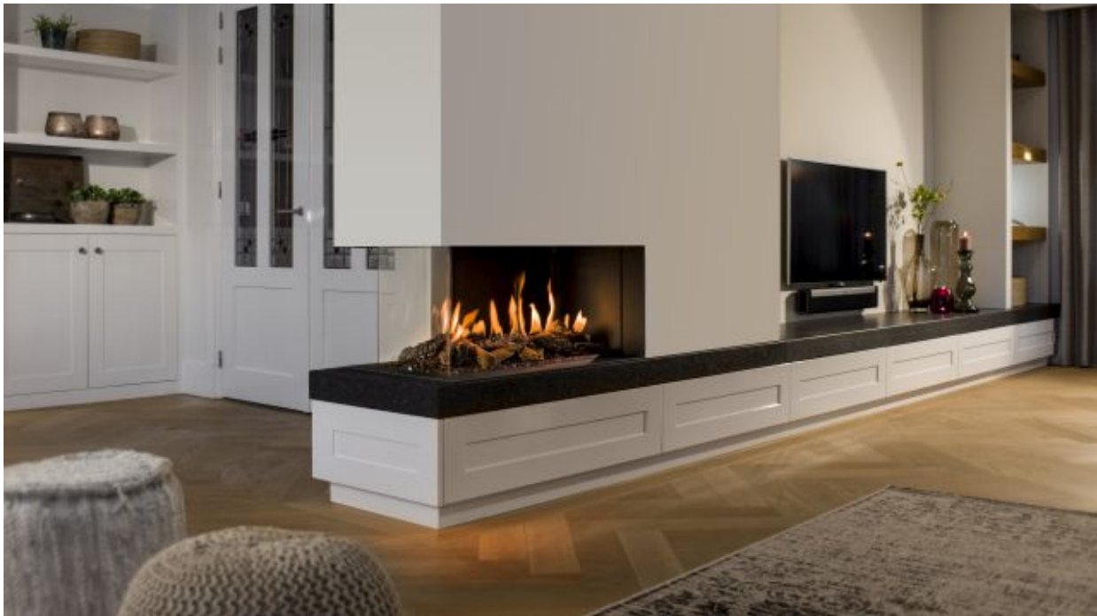
Panorama-Kamin Gas 43/45/38/105