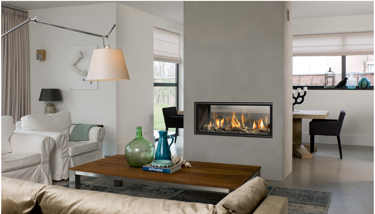
Gas Architektur-Tunnel 40/100